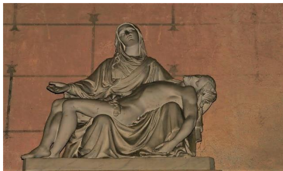
Pietà dans la nef

Lisieux, Pierre et Paul avec l'épée de son martyr).