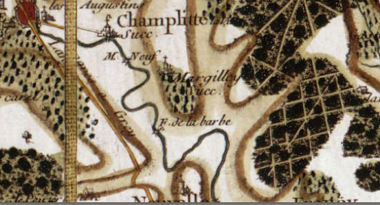
Carte de Cassini

Lieu dit "Le Moulin de la Barbe" : de 1670 à 1812, une usine métallurgique se composant d'une forge et d'un haut-fourneau est installée au bord du Salon. En 1772, l'établissement produit 250 tonnes de fonte et 100 tonnes de fer par an. En 1788, seul le haut-fourneau fonctionne encore.