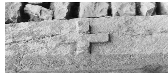
3. Croix de l'ancien presbytère, gravée sur le linteau (en réemploi).