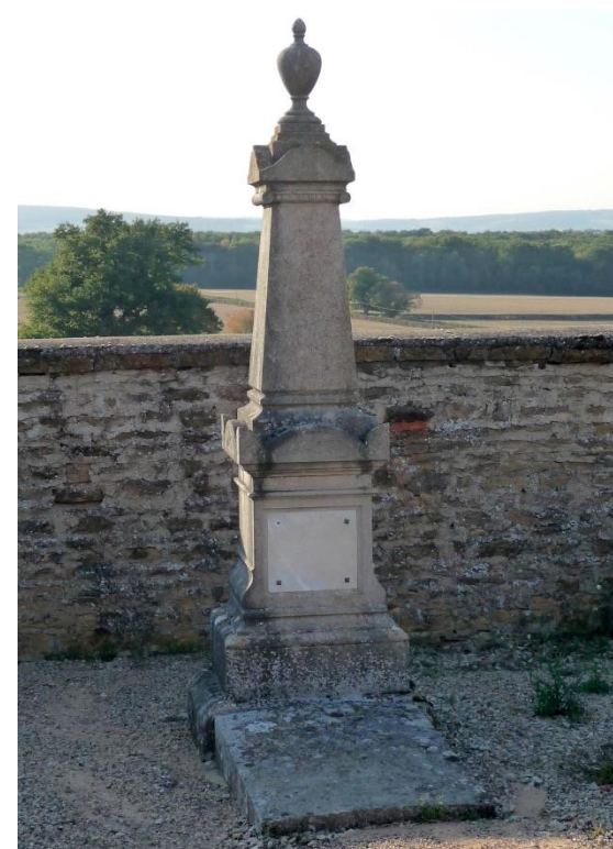
4. Monument funéraire (1855), en bas au milieu du cimetière, là où il y a souvent la