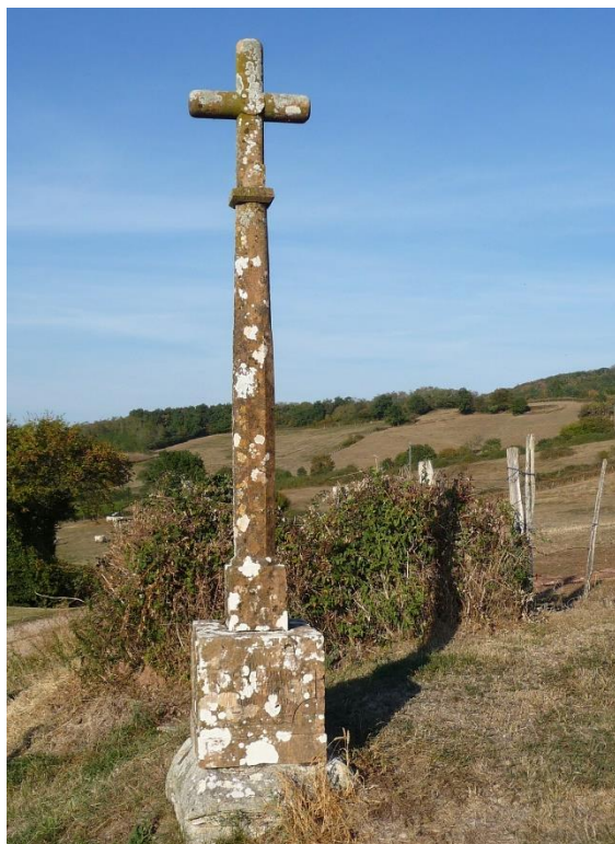
7. Croix du Carge (1793-1856), à Toury, près de Teppe Meux direction Le Bourg. Devant : “Pourquoi craindrions-nous de porter la croix puisque c’est par elle que nous arrivons au Ciel !” Côté droit : “Elevée en 1793” . Côté gauche : “Rétablie en 1856”