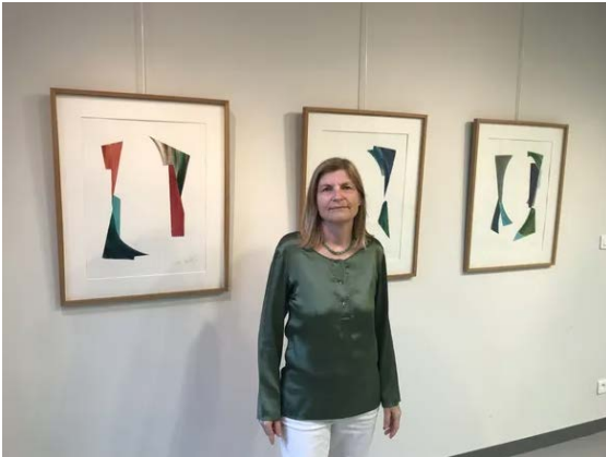
Cécile Willers expose jusqu'au 14 mai prochain.

L'artiste peintre charnacoise Cécile Willers présente une cinquantaine de ses œuvres, en petits et grands formats, à la médiathèque Olympe-de-Gouges de Joigny. Une exposition intitulée « Figures simples », à découvrir jusqu'au 14 mai prochain.