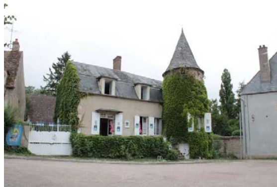
Le premier rendez-vous aura lieu samedi 29 juin, à partir de 15 h 30, à l'Hostellerie de la Tour.

La première journée du festival Nature en Livres se déroulera samedi 29 juin, à partir de 15 h 30, à l'Hostellerie de la Tour. Une journée qui immerge le public dans les enjeux poétiques du vivant et qui donnera le ton à ces six semaines de festival qui, pour sa quatrième édition, sera sous le triple thème : Sport, Corps et Plantes.