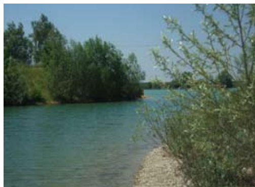
Lac de Desnes, pêche, promenades, loisirs ...