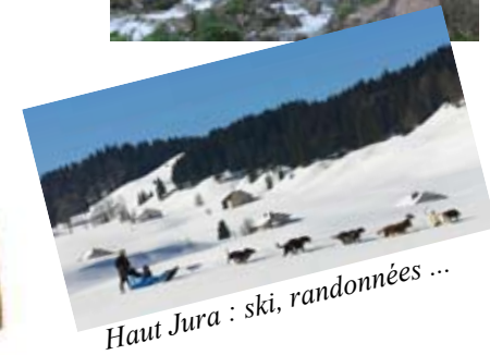
Haut Jura : ski, randonnées ...