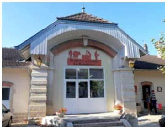
Fruitière à comté de Desnes

Pour vous situer... Territoire de la bresse jurassienne