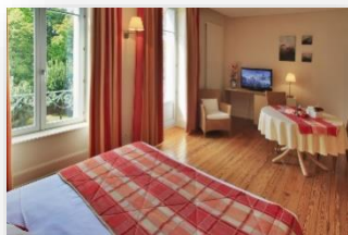
Studio 3 personnes