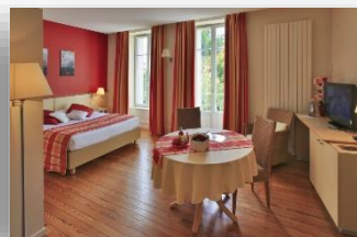
Studio 4 personnes