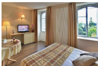
Studio 2 personnes

Ascenseur / Wifi / Parking public / Terrasse / Journaux à disposition / Bibliothèque etc.