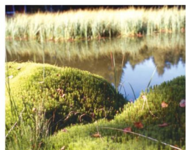
Paysage des 1000 Etangs