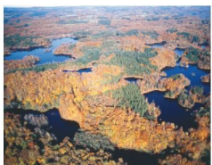
Plateau des 1000 Etangs