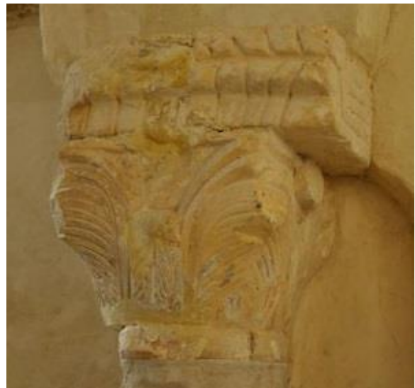
2 chapiteaux anciens