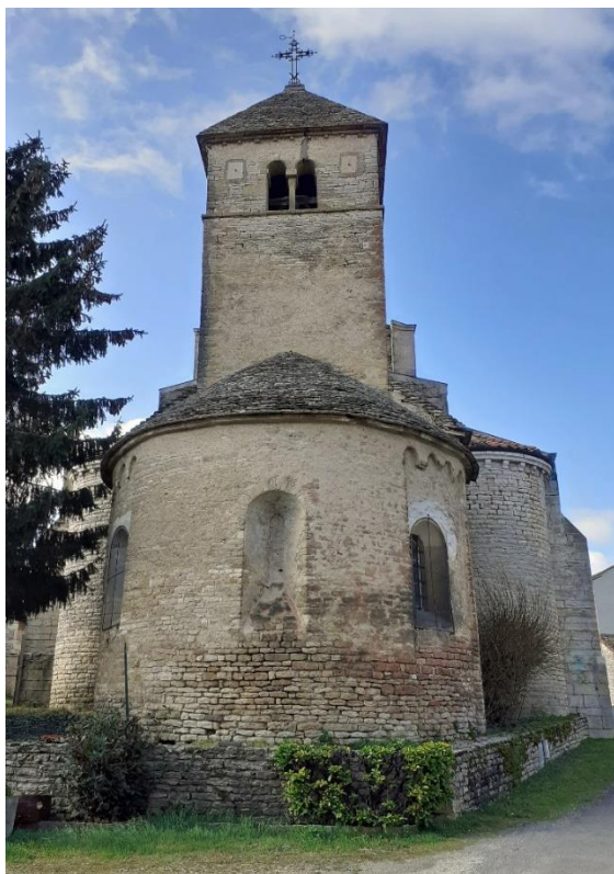
Chevet roman de l'église de Saint-Gengoux

Modillons romans du chevet, à masques humains ou animaux.