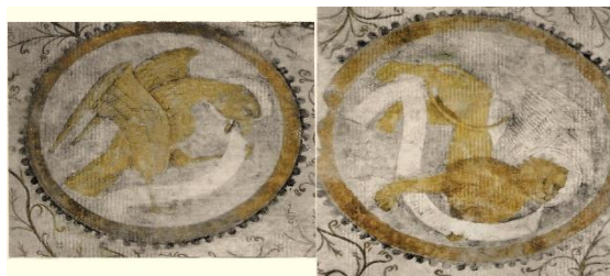
Aigle de saint Jean et lion de saint Marc

Le registre inférieur du mur circulaire de l'abside comporte à gauche de la fenêtre centrale une représentation de saint Adrien . Ce saint, peint en gris avec des rehauts de noir, hormis le lion à ses pieds, est reconnaissable par son armure et l'enclume qu'il tient de la main gauche. A droite de la fenêtre, sainte Barbe tenant la tour de sa main droite est représentée avec les mêmes techniques. Toute cette composition picturale exécutée à la détrempe semble dater de la fin du XVe siècle. La peinture murale a été classée aux MH en 1983.