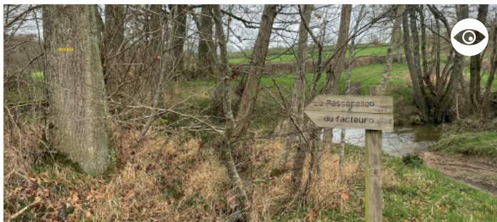
LA PASSERELLE DU FACTEUR