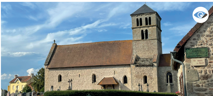
ÉGLISE ROMANE SAINT-SYMPHORIEN