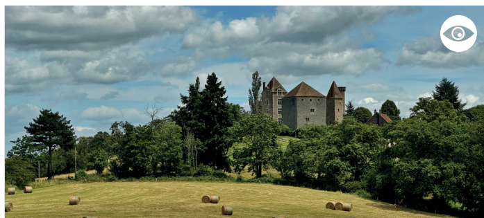
CHÂTEAU DE MARIGNY (PROPRIÉTÉ PRIVÉE)