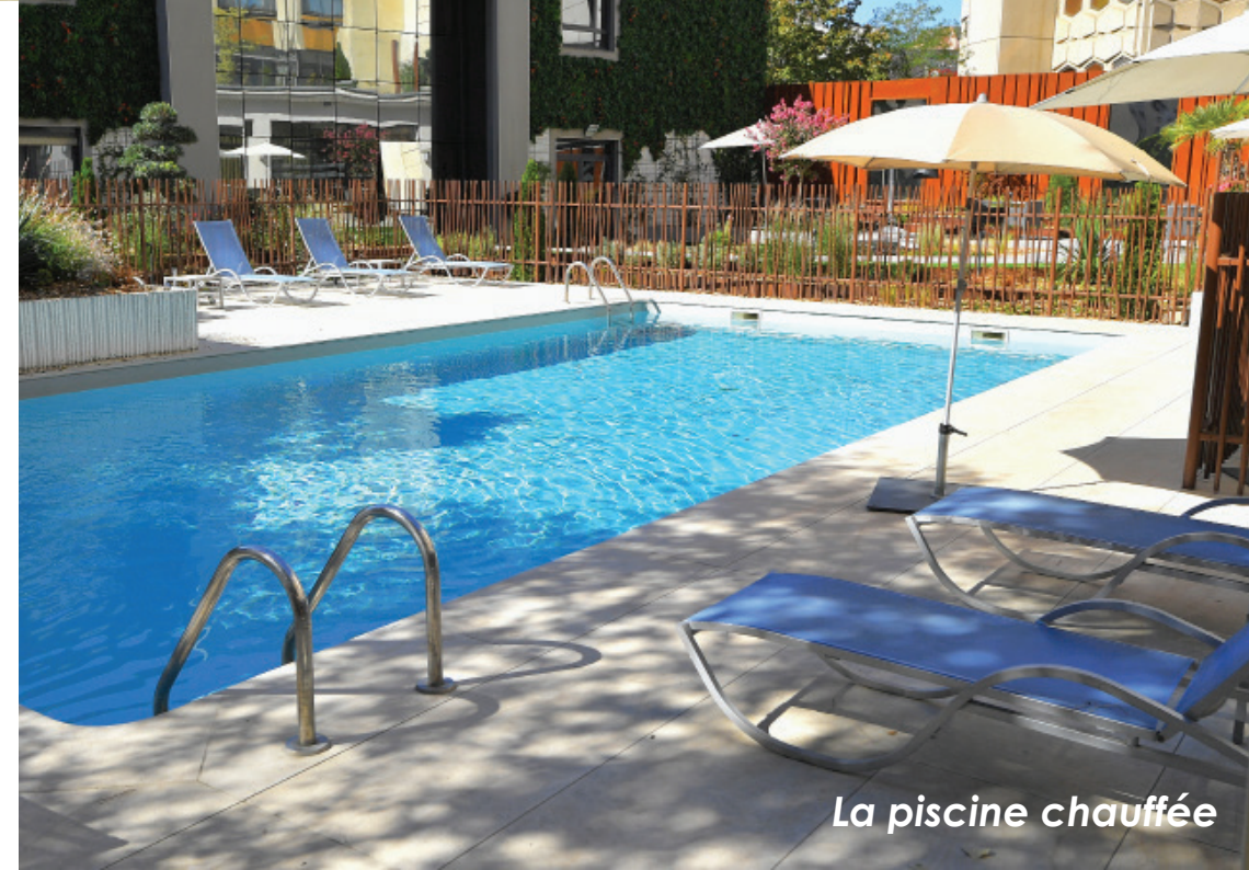
La piscine chauffée

Pour se détendre, une piscine extérieure chauffée, ouverte de mai à octobre, est à la disposition de nos clients. Allongez-vous sur les transats et profitez des rayons du soleil.