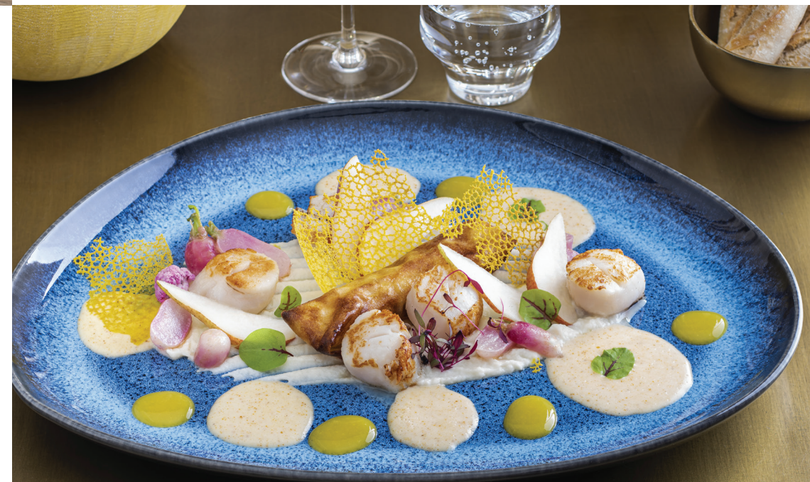
L'ingrédient fétiche du Chef : La Saint-Jacques

Pour terminer en beauté, notre restaurant dispose de ses 3 pâtisseries, pour un délicieux dessert gourmand et fait maison.