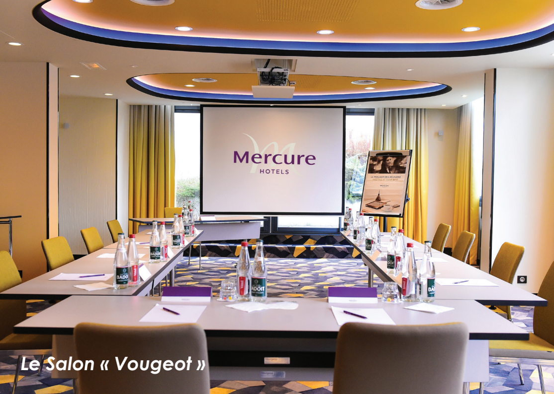
Le Salon « Vougeot »

Un événement professionnel est un moment privilégié, pour lequel vous avez besoin du meilleur ! Pour vos sessions de travail, l'hôtel vous propose 300 m 2 de salons modulables, entièrement équipés d'une connexion WIFI, d'un grand écran avec vidéoprojecteur, d'un paper-board, d'un système de climatisation-chauffage et de tout ce dont vous aurez besoin, sur demande. Les salles peuvent accueillir jusqu'à 200 personnes.