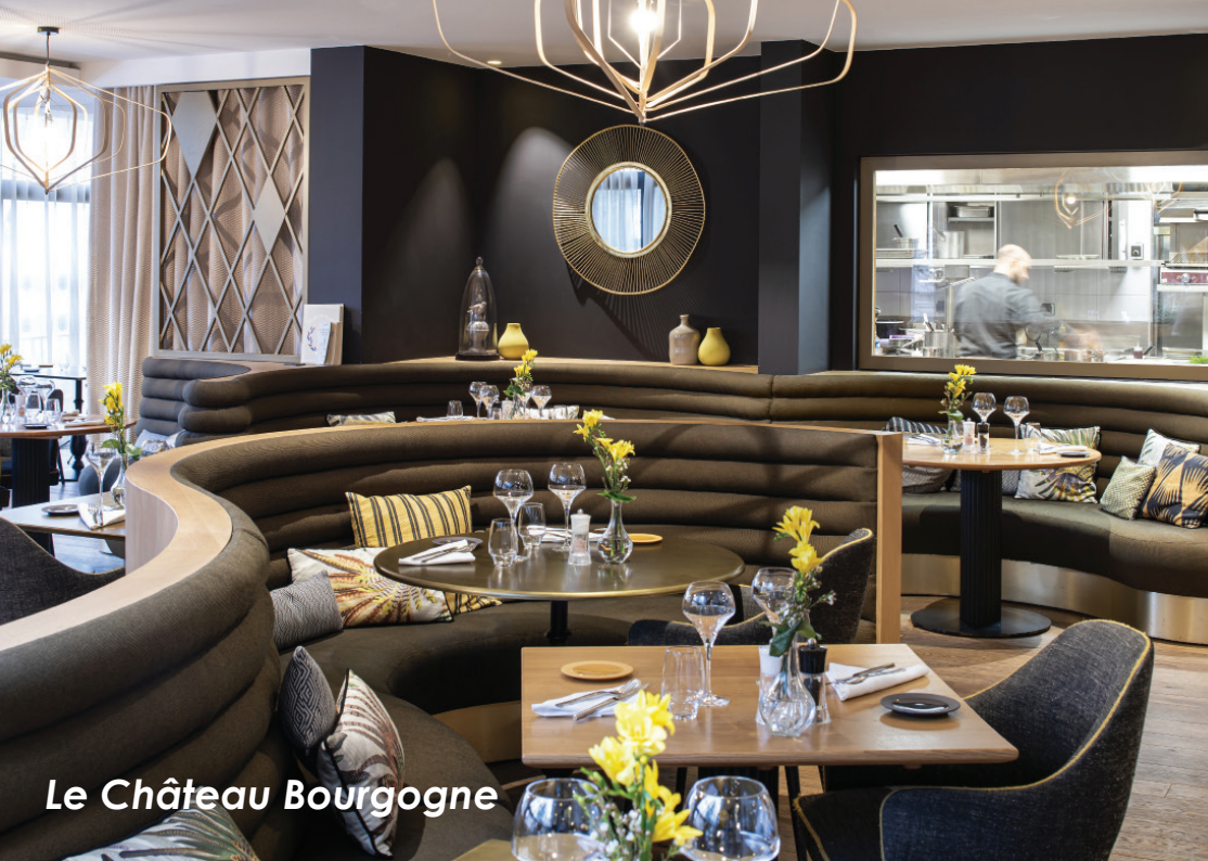
Le Château Bourgogne