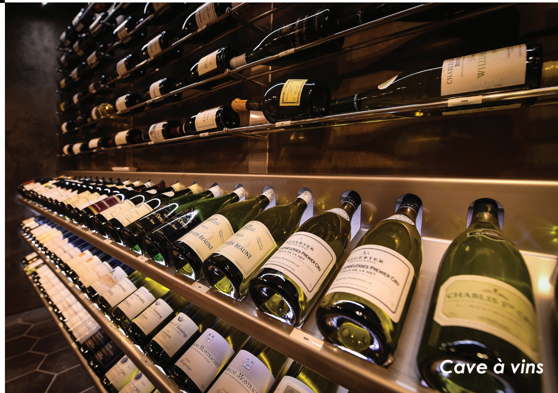
Cave à vins

Aux beaux jours, profitez de la terrasse, avec un jardin verdoyant et une piscine !