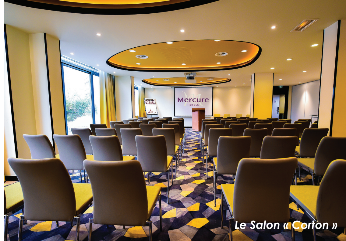
Le Salon « Coton »