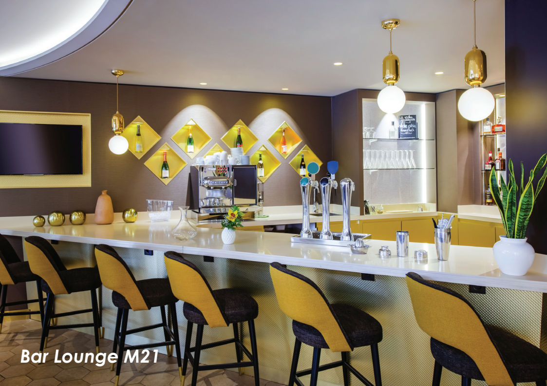
Bar Lounge M21