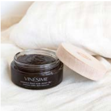
GOMMAGE PINOT NOIR GRAND CRU