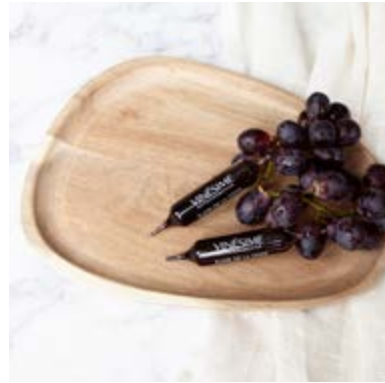
ELIXIR DE LA VIGNE NUTRICOSMETICS