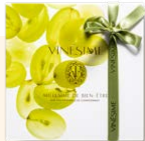
COFFRET DÉCOUVERTE CHARDONNAY