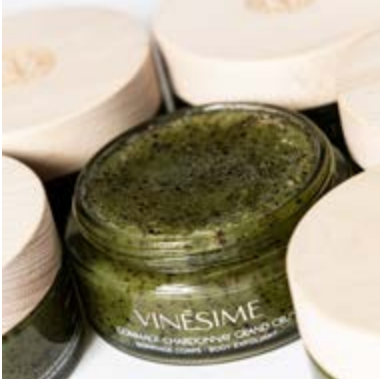
GOMMAGE CHARDONNAY GRAND CRU