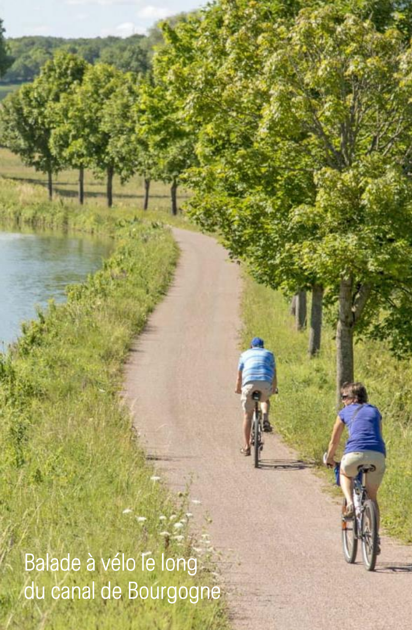
Balade à vélo le long du canal de Bourgogne