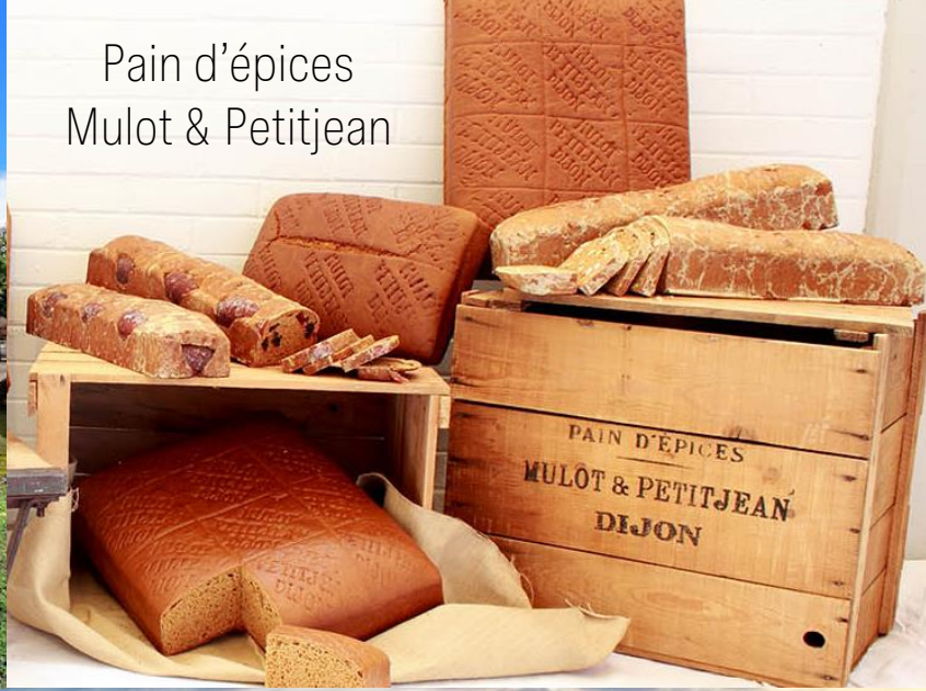
Pain d'épices Mulot & Petitjean