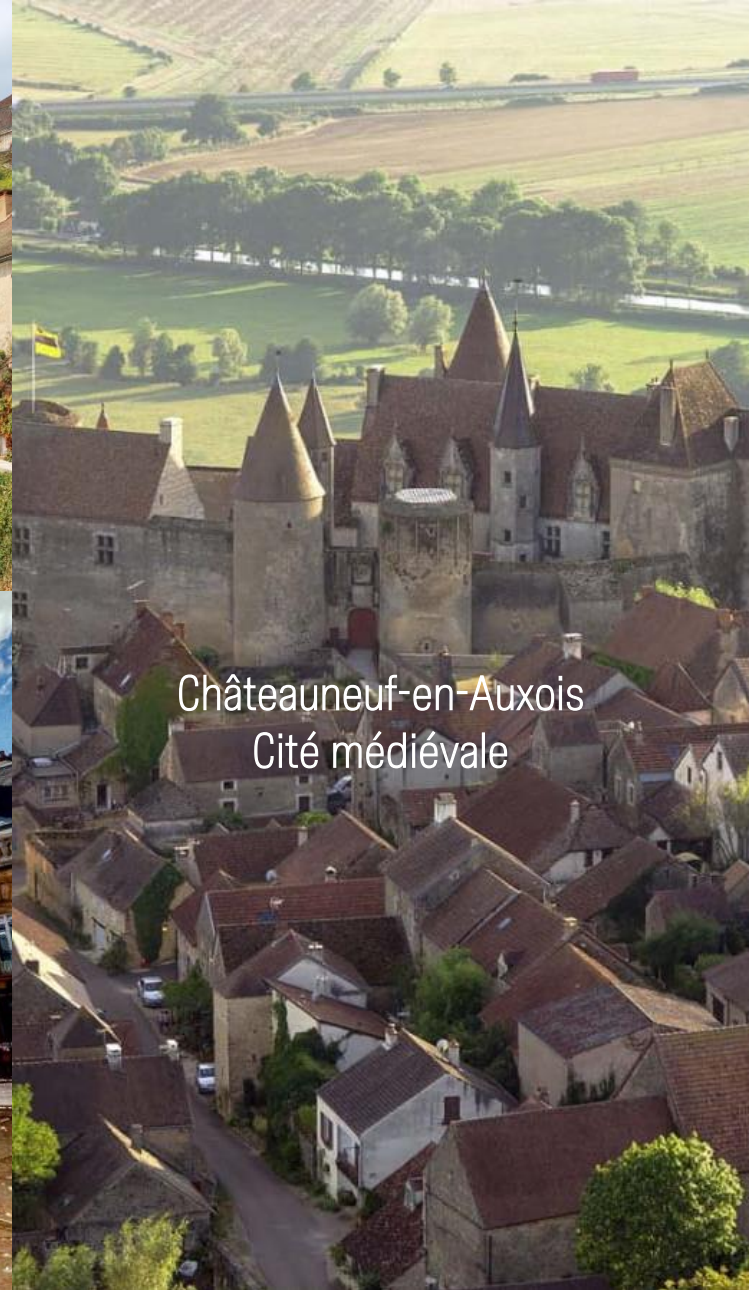
Châteauneuf-en-Auxois Cité médiévale