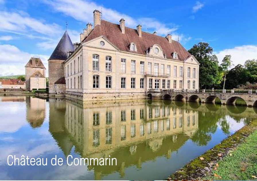
Château de Commarin