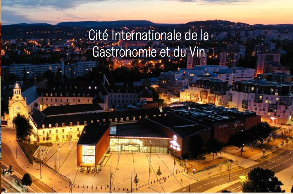
Cité Internationale de la Gastronomie et du Vin