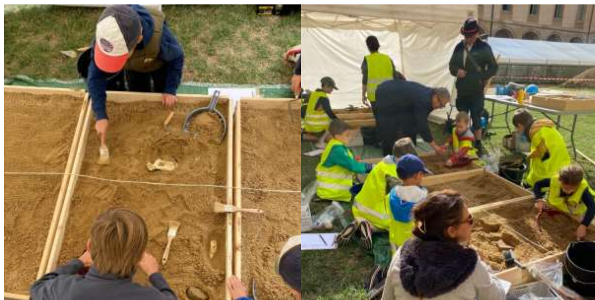
Initiations aux fouilles archéologiques