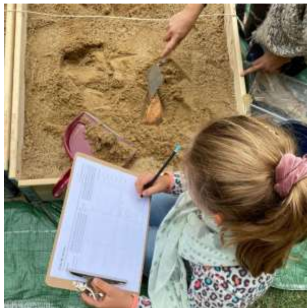
Initiations aux fouilles archéologiques