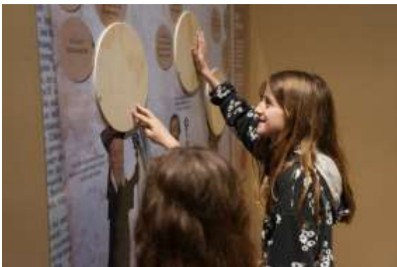
Exposition « Cluny, les abbés du roi »