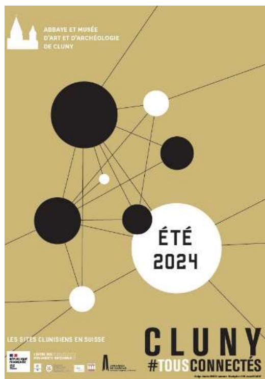
Exposition « Cluny #Tous connectés