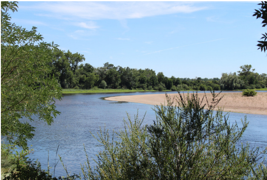
Loire op Port- Thareau