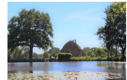
Moulin au loup

Commissie • Comité Départemental de la Randonnée Pédestre de la Nièvre : 03 86 61 87 75, nievre@ffrandonnee.fr , https://nievre.ffrandonnee.fr .