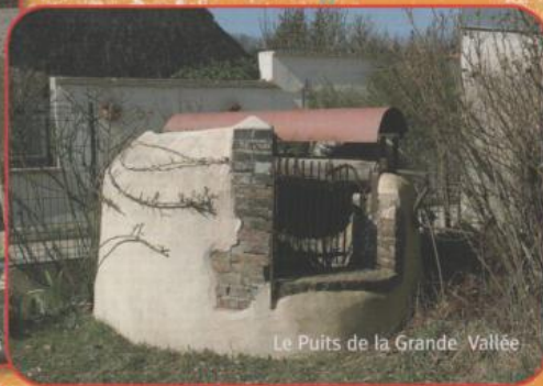
Le Puits de la Grande Vallée

Le village de Dixmont vous propose plusieurs sentiers promenade accessibles à tous. Nos fiches sont à votre disposition au secrétariat de la mairie.