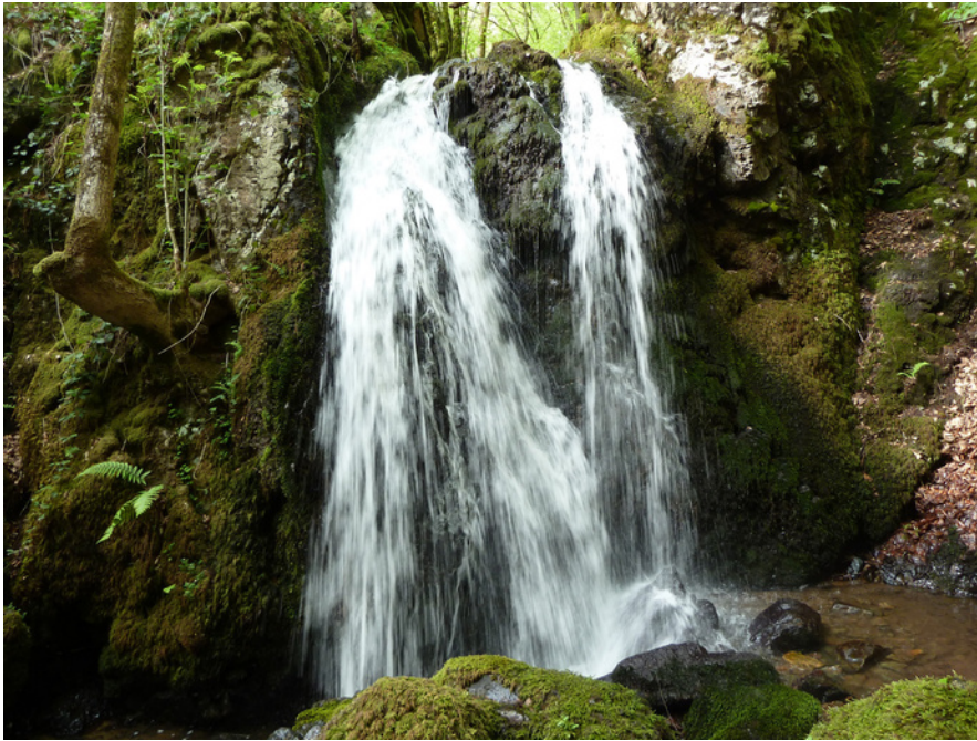
waterval van la Dragne