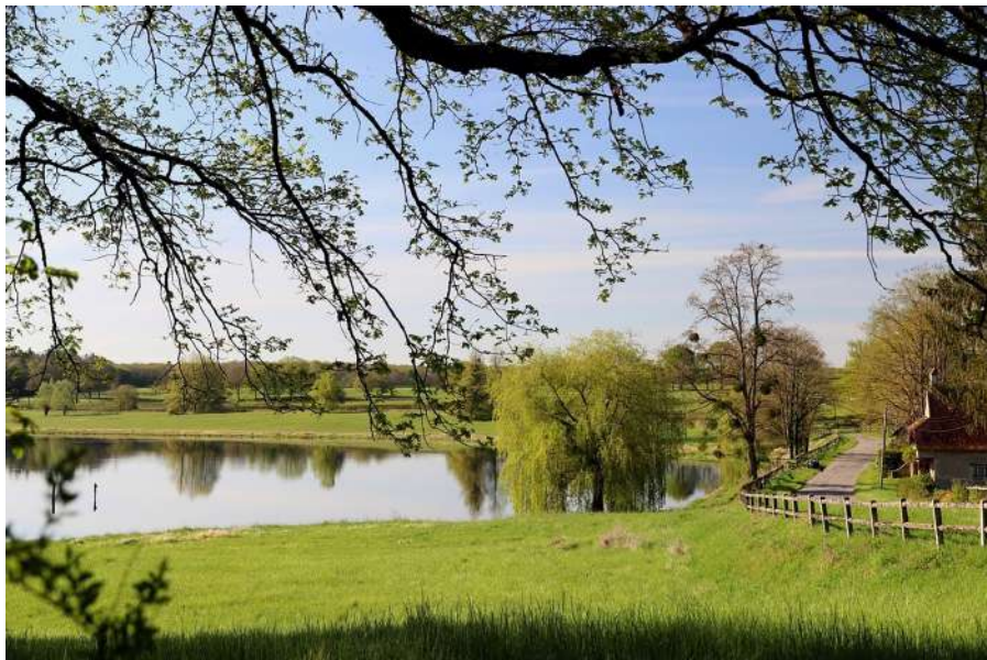
Étang de Chèvres