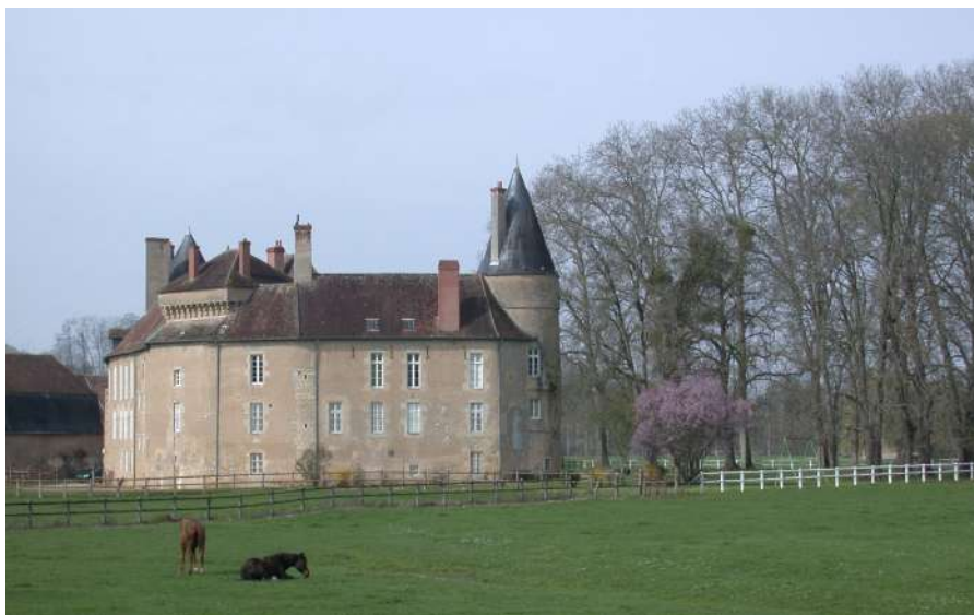
Château de Vandenesse