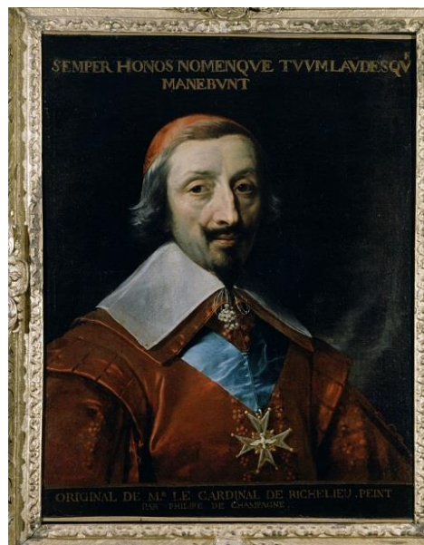
Portrait de Richelieu, abbé de Cluny