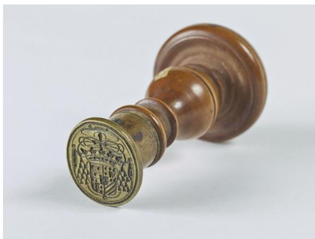
Matrice du sceau Du cardinal de Bouillon, abbé de Cluny