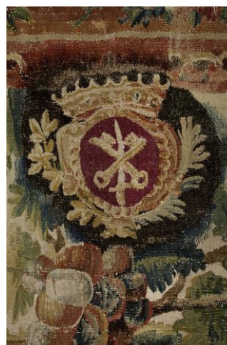
Verdure aux armes de l'abbaye de Cluny, Manufacture d'Aubusson