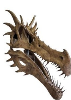
Crâne de dragon

Retrouvez ensuite dans les salles de grandes planches anatomiques d'Arnaud Rafaelian, des textes de Jean-Sébastien Steyer et neuf sculptures volumiques originales réalisées par Ophys : le buste de Darwin avec des oreilles pointues façon Monsieur Spock, la main de Wolverine avec ses griffes, un loup-garou de presque 2 mètres de haut et bien d'autres !