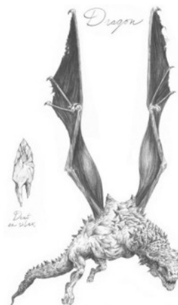
Planche anatomique du dragon

Une exposition construite en partenariat avec le Muséum de Nantes, le Muséum de Montbéliard et le Musée Buffon de Montbard. Déjà présentée à Montbéliard et Nantes, l'exposition partira pour Montbard après sa présentation à Auxerre.