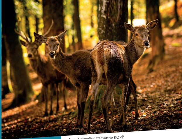
Parc Animalier