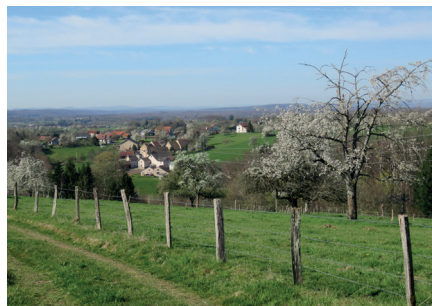
Vue sur le hameau de la Ramouse

Conception : Balades d'Hier et d'Aujourd'hui - Ne pas jeter sur la voie publique - Imprimé sur du papier recyclé.