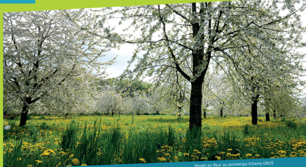
Verger en fleur au printemps

Entre nature, mémoire et mystères, le sentier des Pierres de Roûge vous invite à une balade au cœur du patrimoine fougerollais. Au fil du chemin, découvrez les secrets des prés-vergers, des forêts, des ruisseaux et des roches de grès façonnées par le temps, la nature et l'Homme. Un voyage sensoriel et immersif à la rencontre d'un paysage vivant.