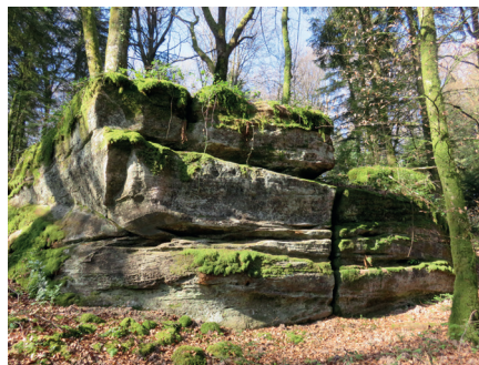
Bloc de grès