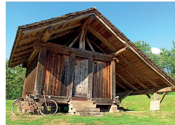
Chalot de l'Écomusée

Un ponton vous mène au pied des falaises des Pierres de Roûge en longeant le ruisseau des Pochattes à gauche, territoire d'une espèce protégée : l'écrevisse à pattes blanches.