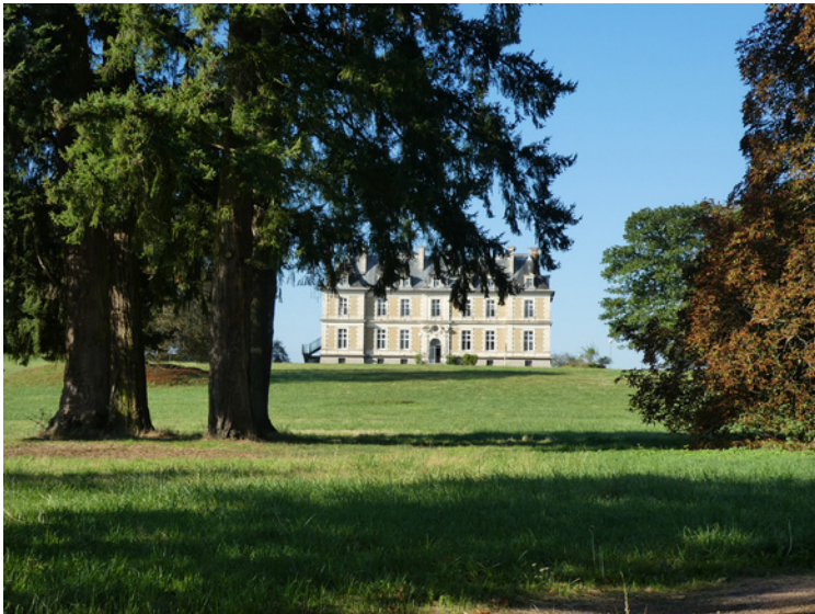
kasteel van Tintury