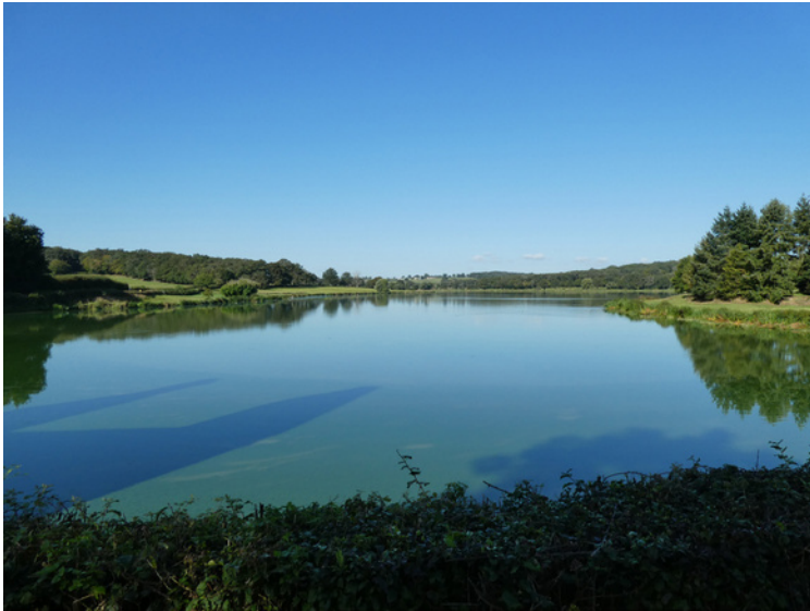
Vijver van Fleury- la-Tour