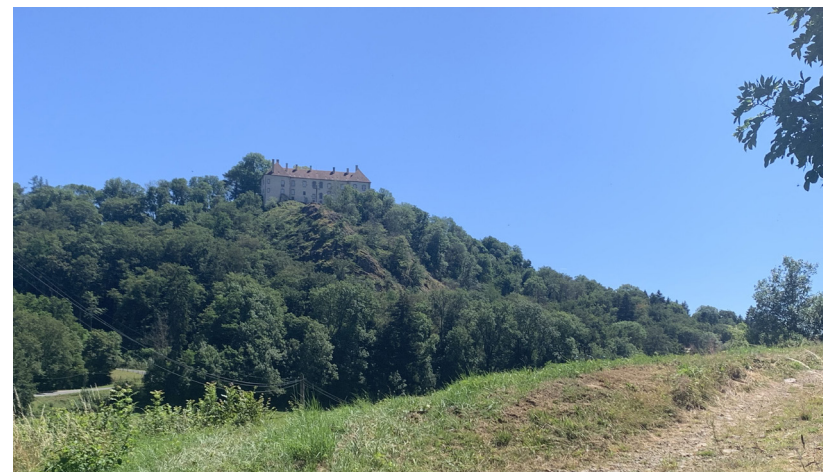
Vue sur le château de Larochemillay