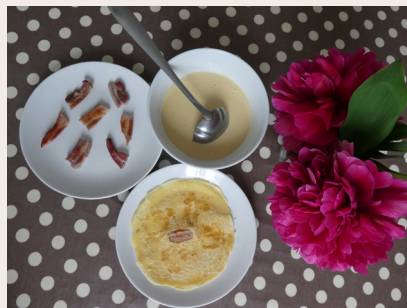
Crapiaux du Morvan