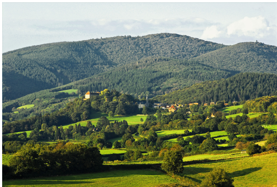
Larochemillay et Mont Beuvray