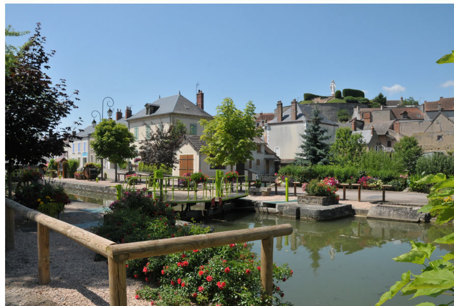
Écluse à Cercy-la-Tour