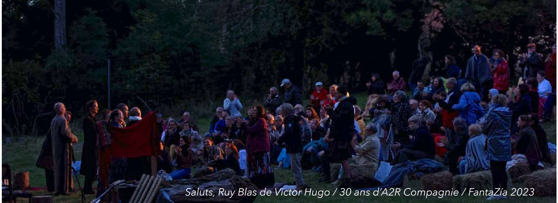
Saluts, Ruy Blas de Victor Hugo / 30 ans d'A2R Compagnie / FantaZía 2023