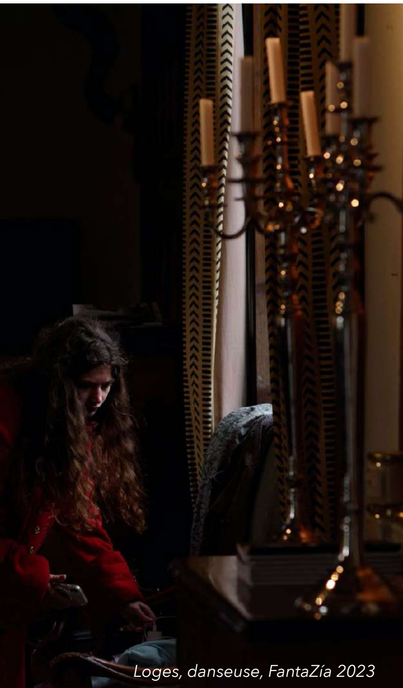
Loges, danseuse, FantaZía 2023