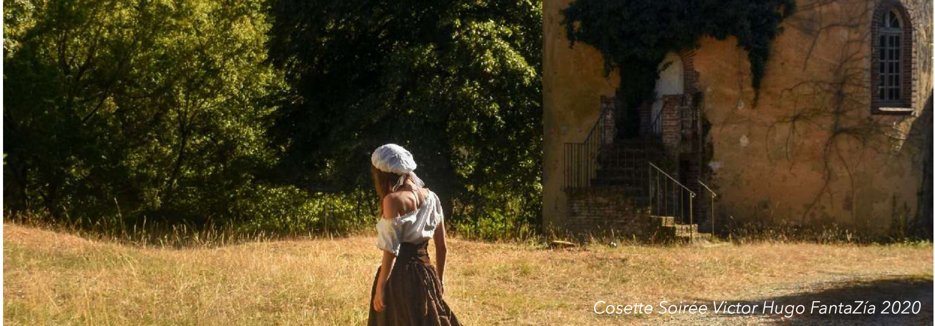
Cosette Soirée Victor Hugo FantaZía 2020