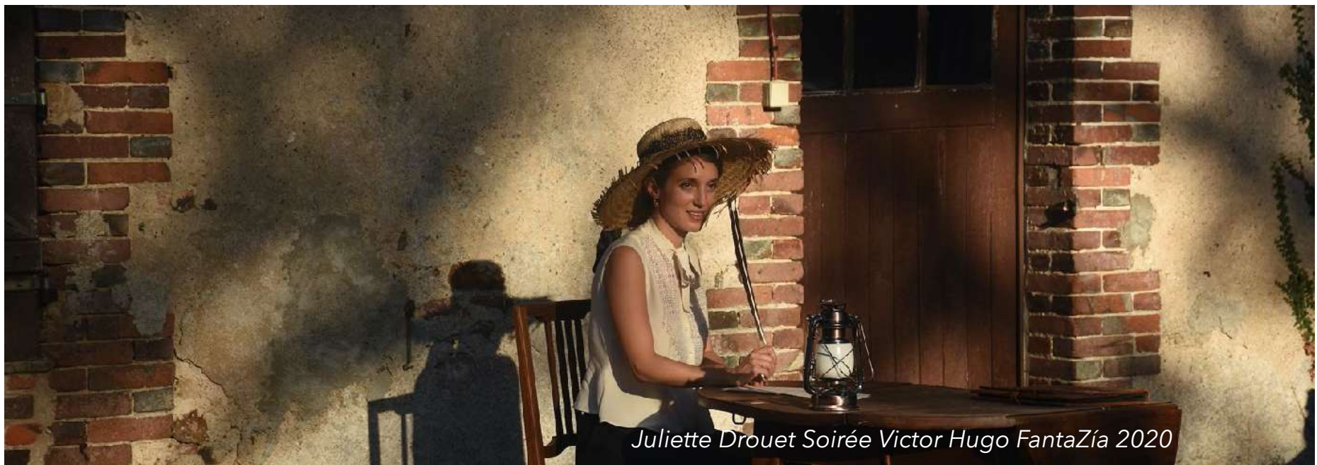
Juliette Drouet Soirée Victor Hugo FantaZía 2020