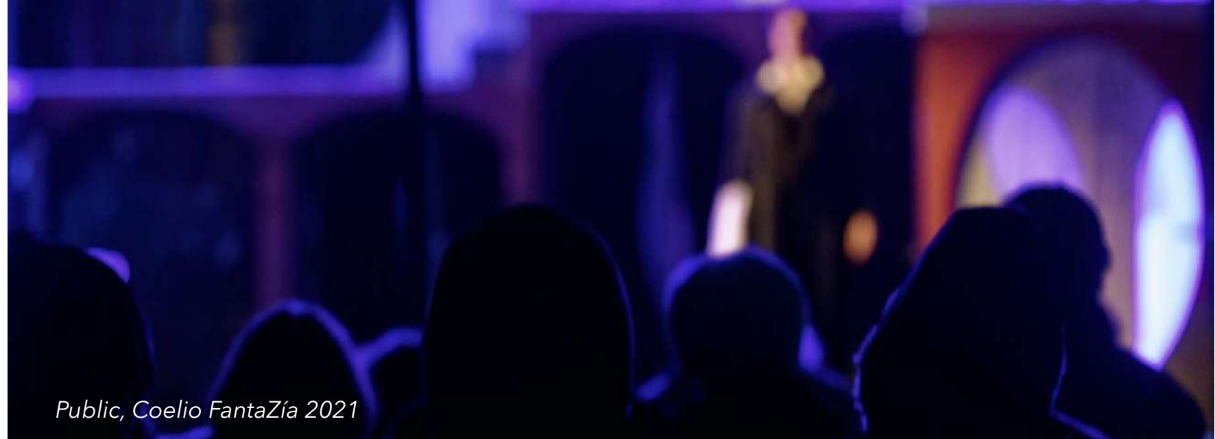
Public, Coelio FantaZía 2021