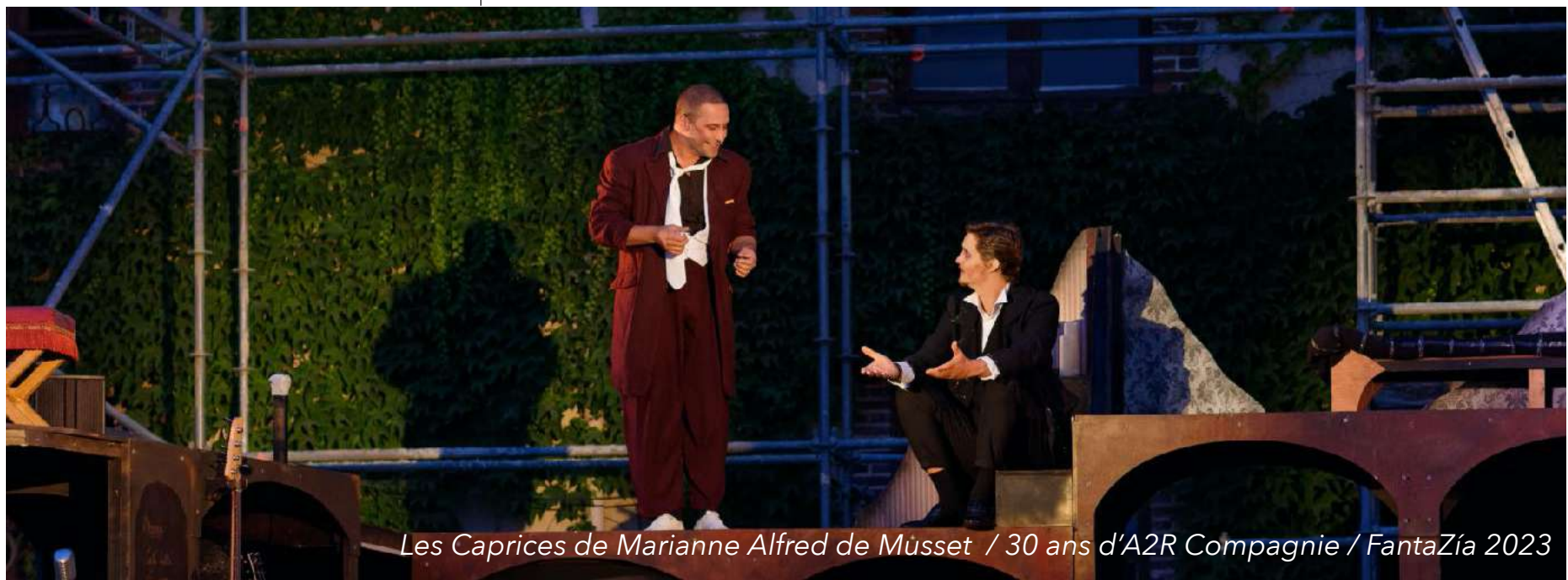
Les Caprices de Marianne Alfred de Musset / 30 ans d'A2R Compagnie / FantaZía 2023