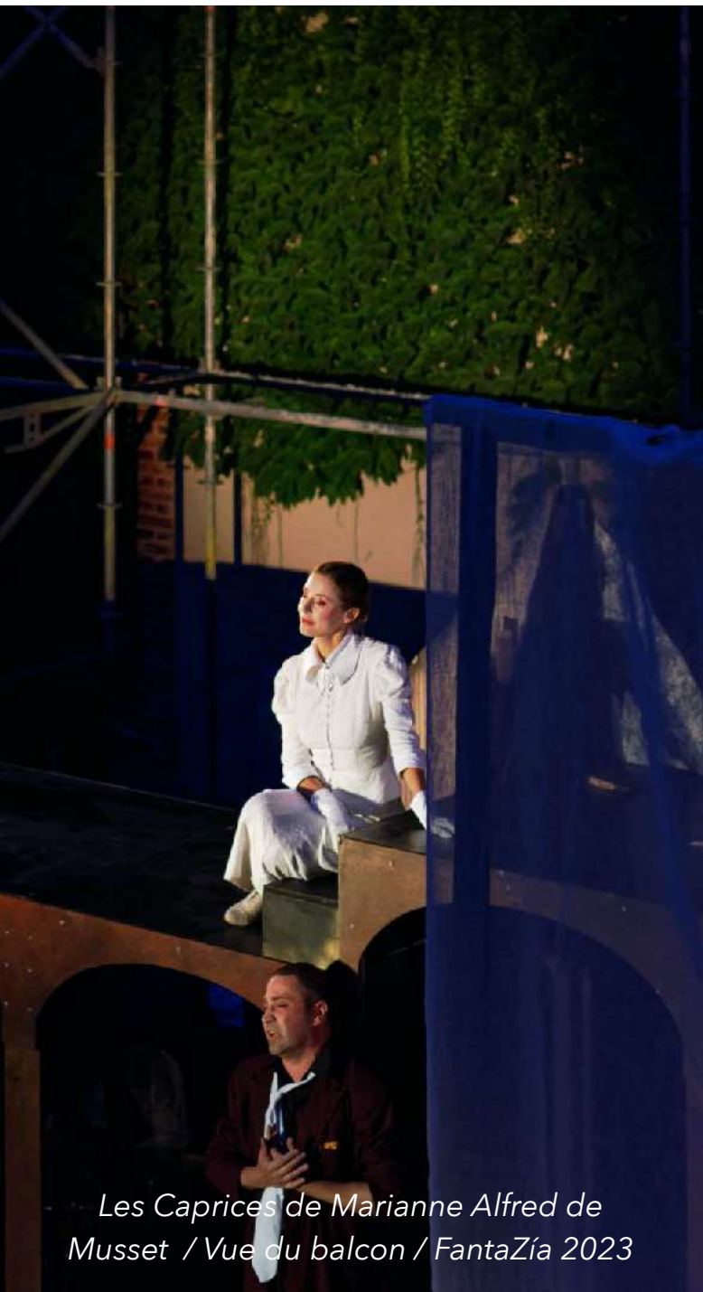
Les Caprices de Marianne Alfred de Musset / Vue du balcon / FantaZía 2023