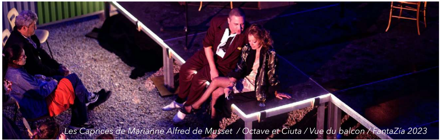
Les Caprices de Marianne Alfred de Musset / Octave et Ciuta / Vue du balcon / FantaZía 2023