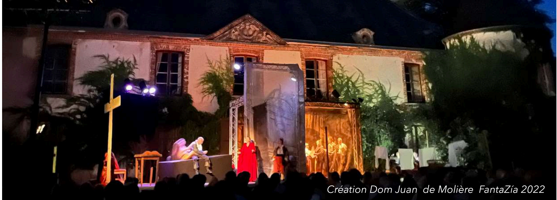
Création Dom Juan de Molière FantaZía 2022