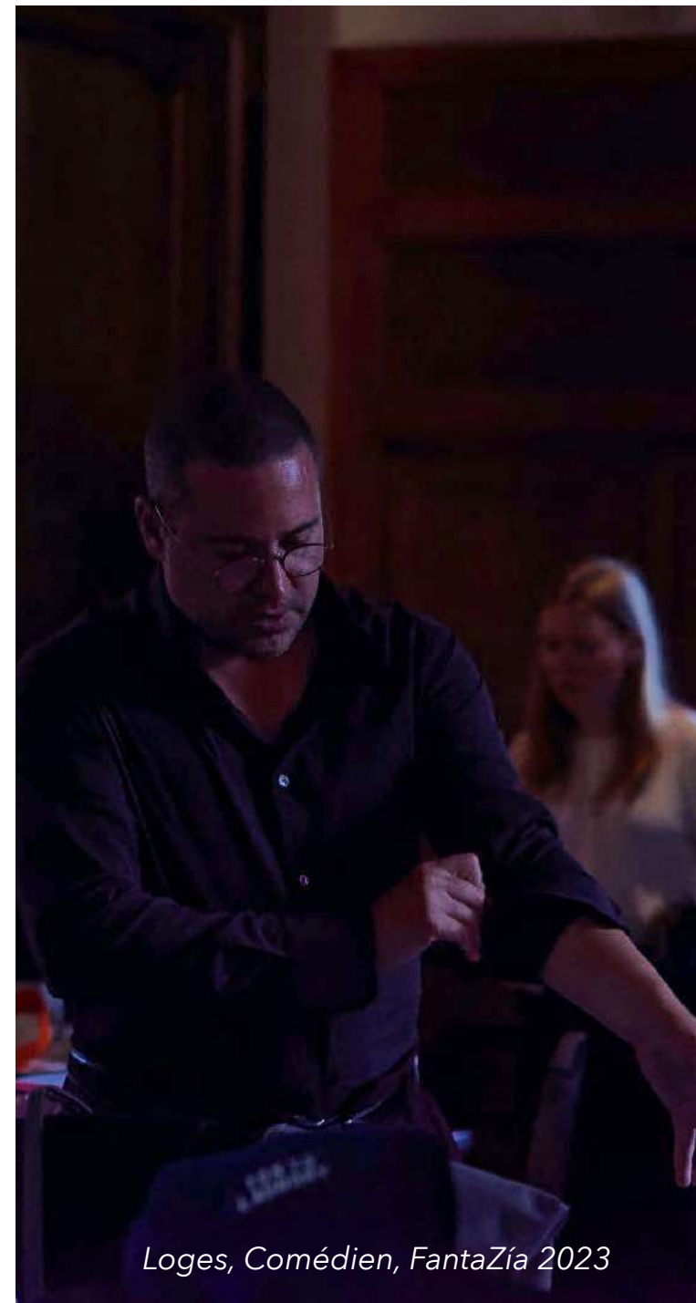
Loges, Comédien, FantaZía 2023