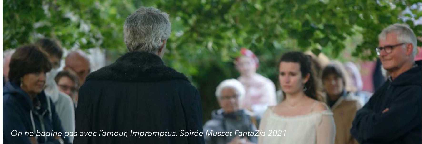
On ne badine pas avec l'amour, Impromptus, Soirée Musset FantaZia 2021