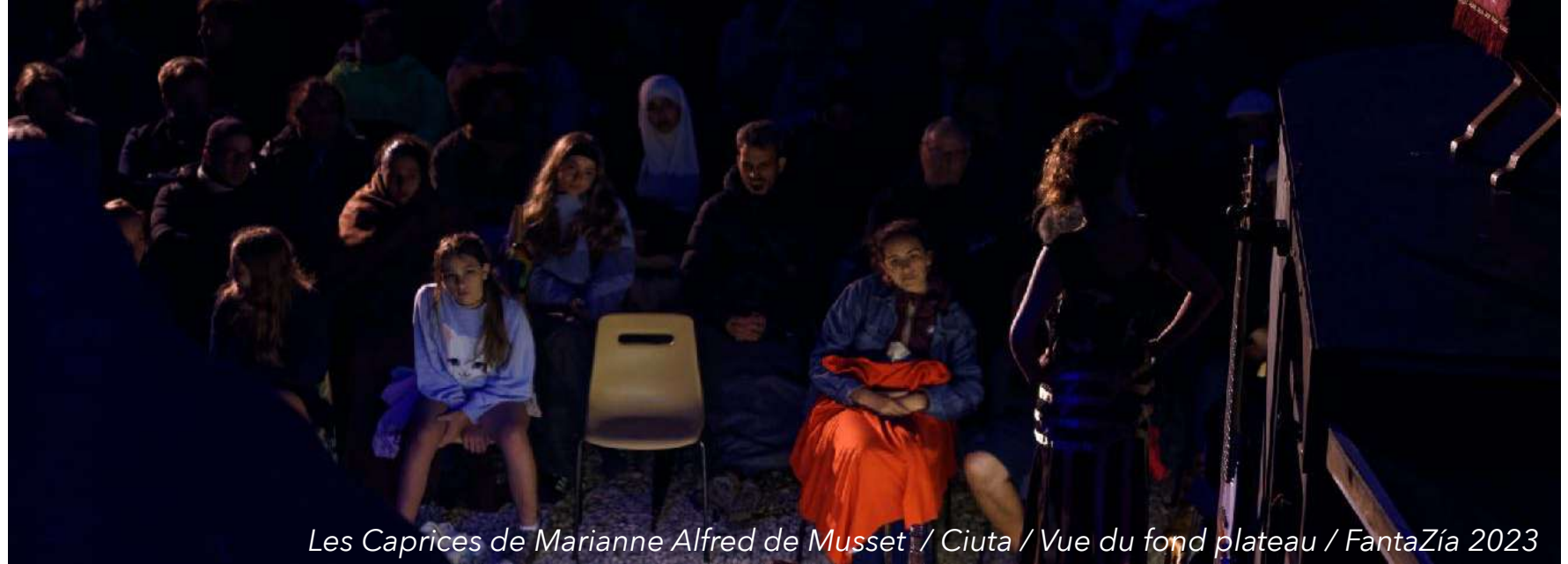
Les Caprices de Marianne Alfred de Musset / Ciuta / Vue du fond plateau / FantaZía 2023