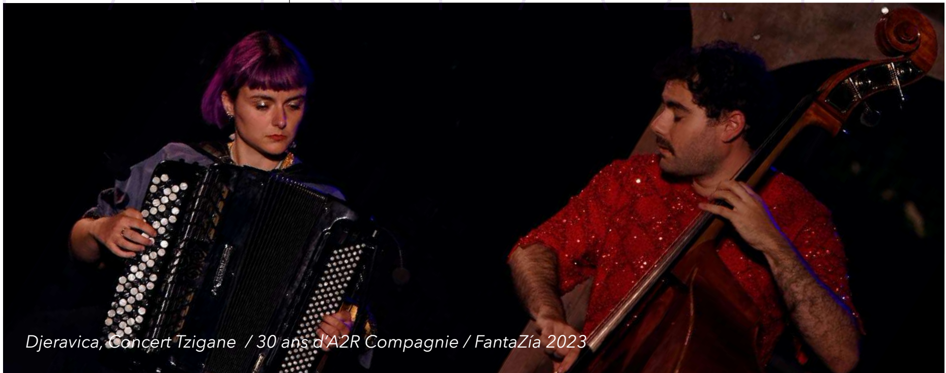
Djeravica, Concert Tzigane / 30 ans d'A2R Compagnie / FantaZía 2023