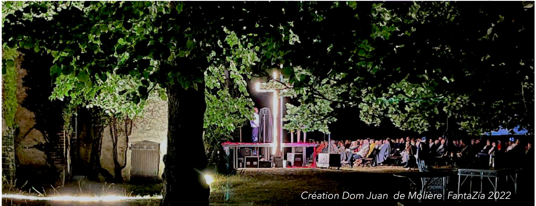
Création Dom Juan de Molière FantaZía 2022