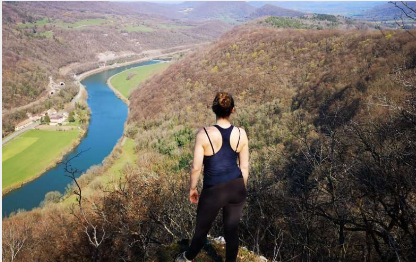
Randonneuse depuis le point de vue de la Combe au Louvier (Office de Tourisme du Doubs Baumois)