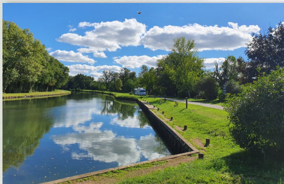
Vue depuis la Halte Nautique