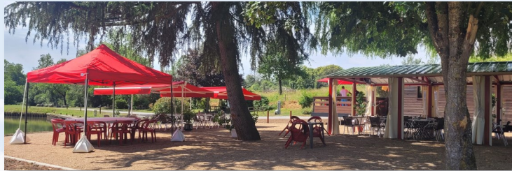
Terrasse de la Halte Nautique