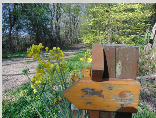
Panneau de signalétique