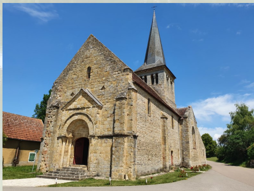
Eglise Saint-Laurent - Point de départ