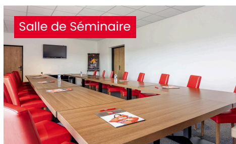
Salle de Séminaire