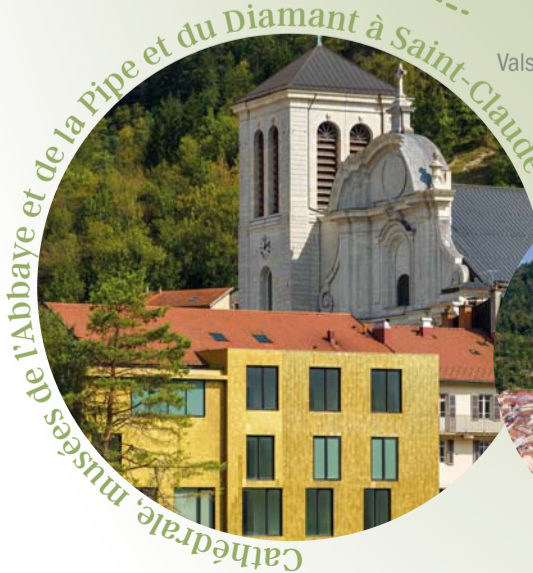
Cathédrale, musées de la Pipe et du Diamant à Saint-Claude