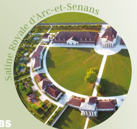
Saline Royale d'Arc-et-Senans