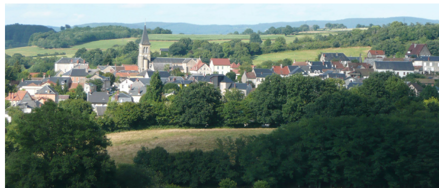
Panorama sur Saint-Honoré-les-Bains