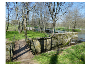
La rivière Aron à Coeuillon