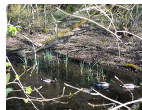
Colverts près du canal