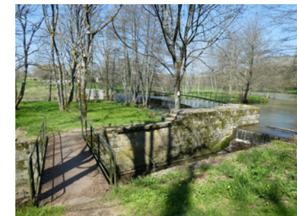
Rivier Aron op Coeuillon