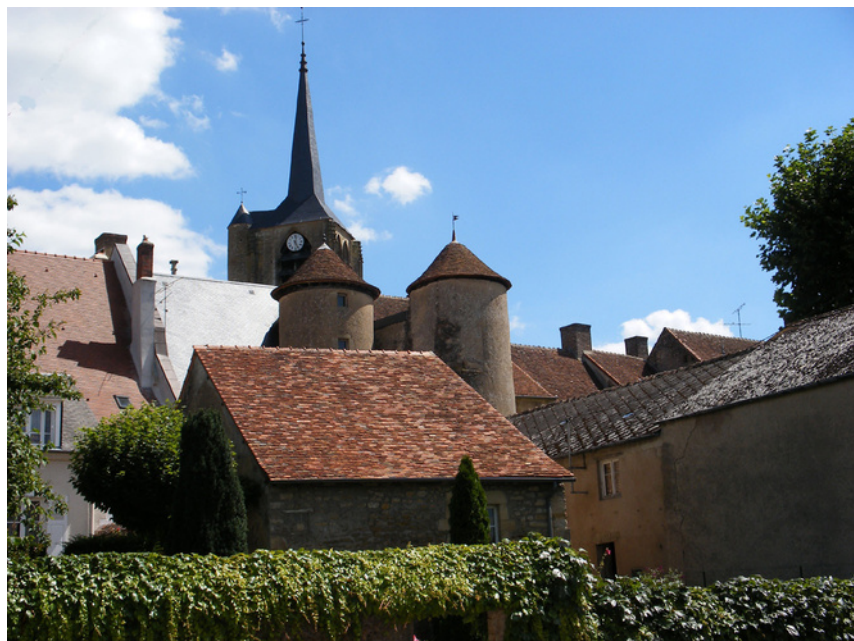
Dorp van Moulins- Engilbert