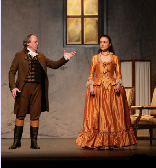
Le rêve de Mercier

Paris, juillet 1794, sous la Terreur. Françoise-Thérèse de Choiseul-Stainville, jeune aristocrate française devenue princesse de Monaco par mariage, est emprisonnée depuis plusieurs mois.