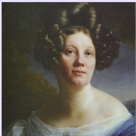
Honorine Camille Athénaïs Grimaldi, princesse de Monaco, par le peintre Hersent

Le 5 juin 1595, le village de Fontaine-Française fut le théâtre d'une célèbre victoire du roi Henri IV sur les Espagnols et la Ligue. Fontaine-Française fut le fief de nobles familles qui, à l'instar des Grimaldi de Monaco, ont marqué l'histoire locale de leur empreinte.