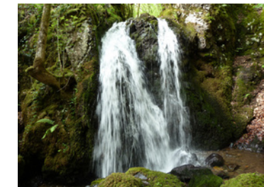
waterval van la Dragne