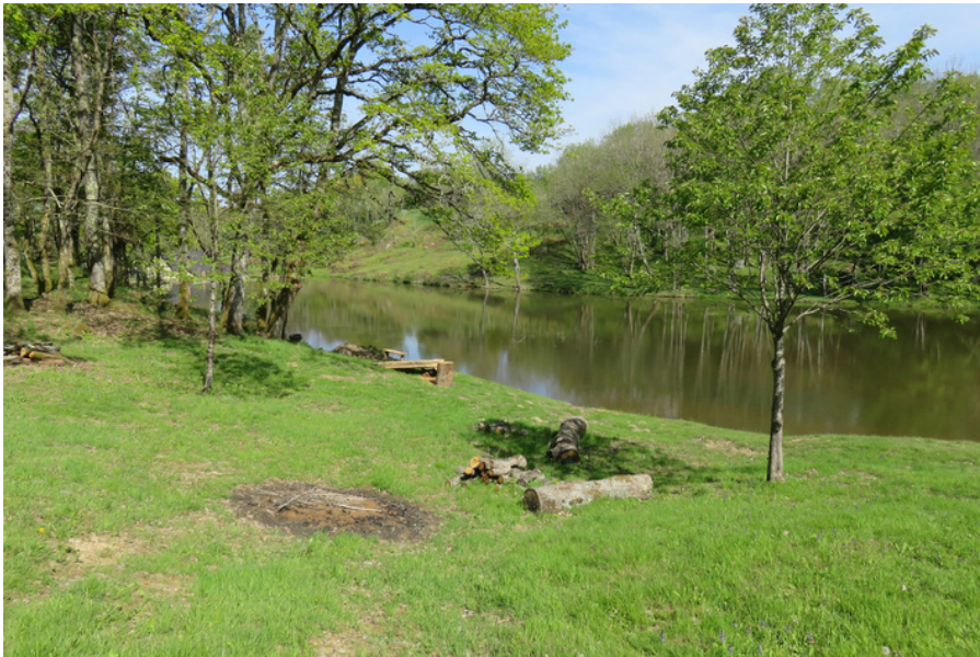
Vijver van molen van Queudre