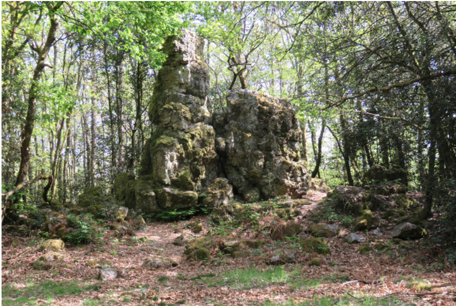
La Pierre Aiguë