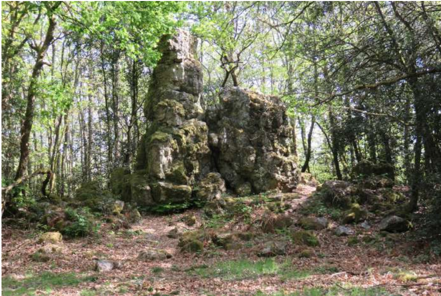
La Pierre Aiguë