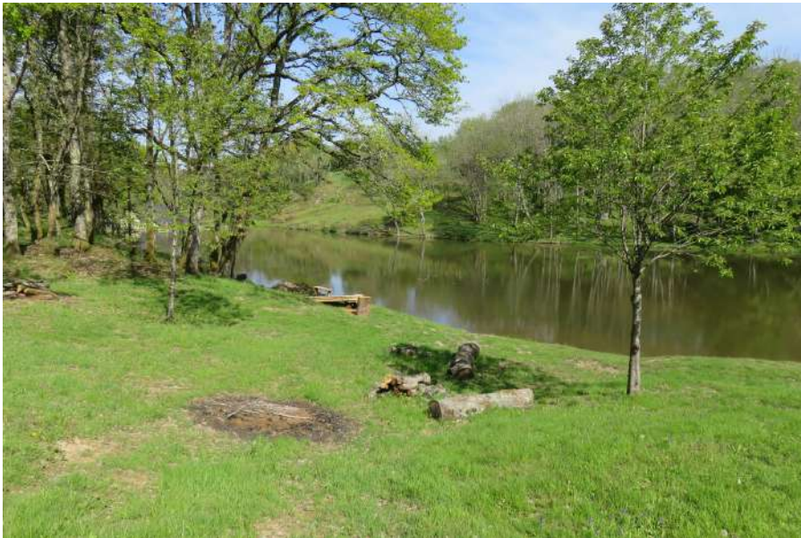
Étang du moulin de Queudre