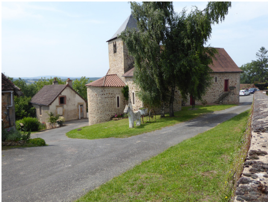
kerk van Lanty