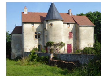
dorp kasteel van Rémilly