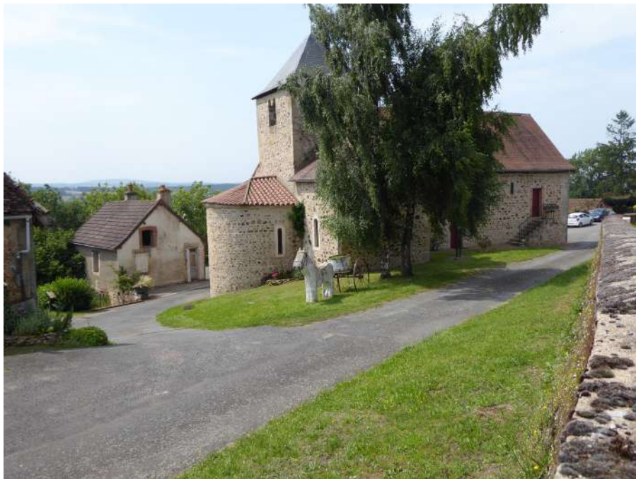
Eglise de Lanty