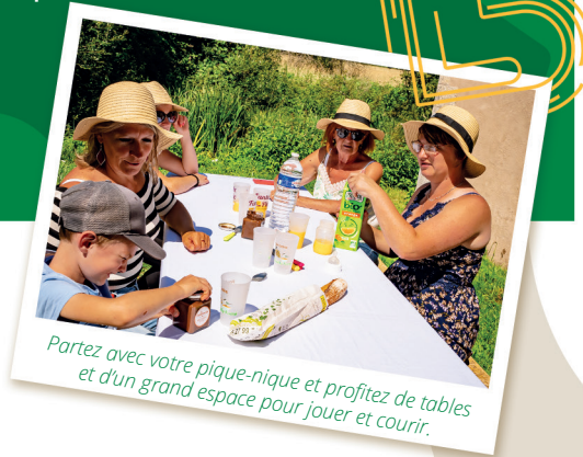
Partez avec votre pique-nique et profitez de tables et d'un grand espace pour jouer et courir.

● Départ : Parking de l'église Saint Martin à Ciez