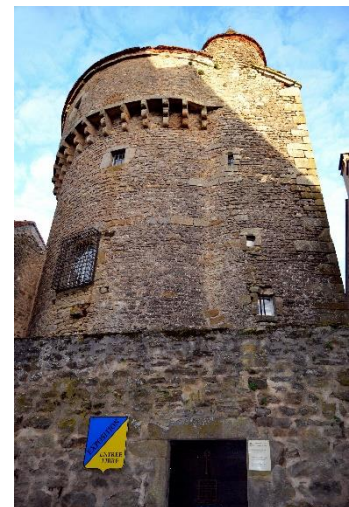
Image : "La Tour de la Motte-Forte | Tourisme Pays Arnay-Liernais"

Des travaux de restauration de la toiture ont été réalisés entre 2022 et 2024.