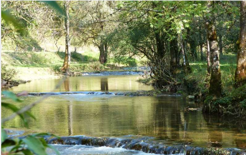
Bords du Cusancin