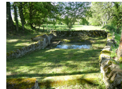
Lavoir des Etournelles

Commissie • Comité Départemental de la Randonnée Pédestre de la Nièvre : 03 86 61 87 75, nievre@ffrandonnee.fr , https://nievre.ffrandonnee.fr .