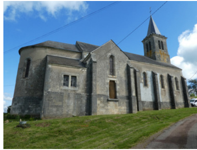
kerk van Saint André