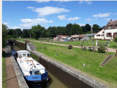
Dubbele sluis van Mont- et- Marré.

De dubbele sluis gebouwd onder Marré draagt de nummers 9 en 10 van de Loire kant. Het bestaat uit een dubbele slotkamer waardoor boten een significant niveauverschil kunnen overbruggen. De mooie sluiswachterswoning was vroeger het huis van de sluiswachter en zijn familie. Aan deze sluiswoningen bevond zich ook een stal om de paarden te huisvesten tijdens de nacht, evenals een kippenhok, een bakkerij, een tuin en een boomgaard. Er was veel ruilhandel tussen sluiswachters en onderhandelaars.