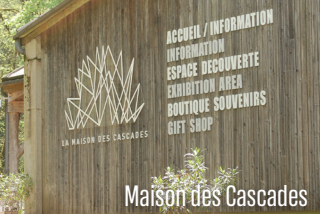
Maison des Cascades