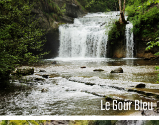
Le Gour Bleu