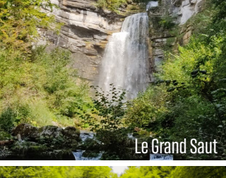
Le Grand Saut