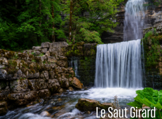
Le Saut Girard