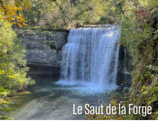
Le Saut de la Forge