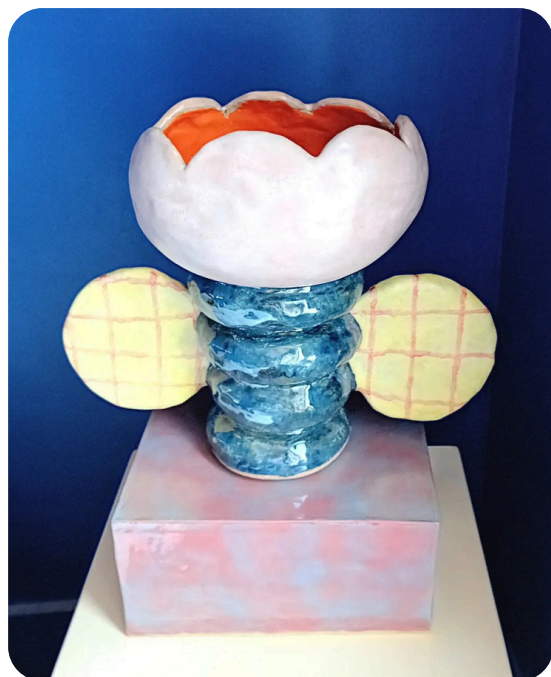
Pièces en céramique

Matthieu Louvrier travaille la céramique depuis plus de deux ans. Ce médium ravive la part de jeu intrinsèque au monde de l'enfance et l'artiste explore les formes rondes, naïves pour nous proposer de singulières sculptures, inspirées de l'idée de fleur pour l'emmener vers de fantasques représentations.