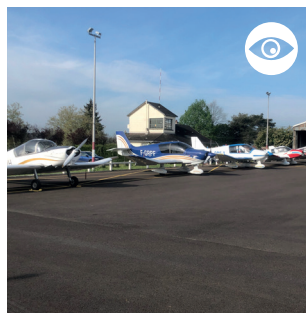
AÉRO-CLUB DU BASSIN MINIER Hors parcours