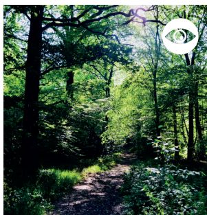
BOIS DE THOMASSE