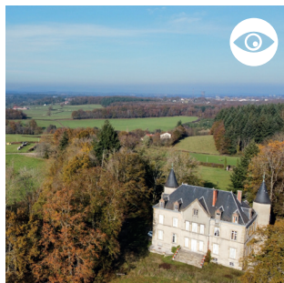
CHÂTEAU DU MARTRET Propriété privée