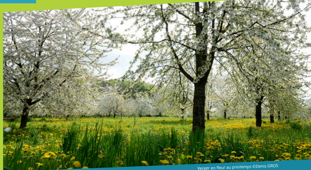
Verger en fleur au printemps

Der Pfad der « Pierres de Roûge » verbindet Natur und Geschichte und lädt zu einer Entdeckungstour durch die Landschaft von Fougerolles ein. Unterwegs entdeckt ihr die Geheimnisse der Streuobstwiesen, der Wälder, der Bäche und der Sandsteinfelsen, die im Laufe der Zeit von Natur und Mensch geformt wurden. Eine sinnliche und immersive Entdeckungsreise durch eine lebendige Landschaft.