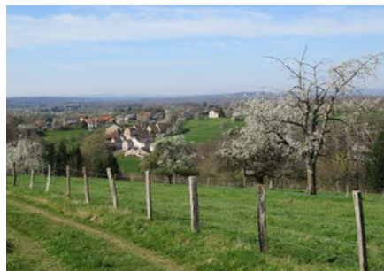
Ausblick auf den Weiler La Ramouse