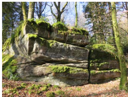
Sandsteinblock ©Sylvie RIETH