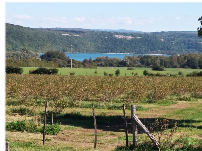
Vue sur le Lac de Chalain depuis le Gîte

Avec sa magnifique vue sur le lac de Chalain, notre gîte de 60 m 2 pour 4 personnes, tout confort, de plain-pied, sans vis-à-vis et totalement indépendant, vous assurera de passer été comme hiver, un agréable séjour.